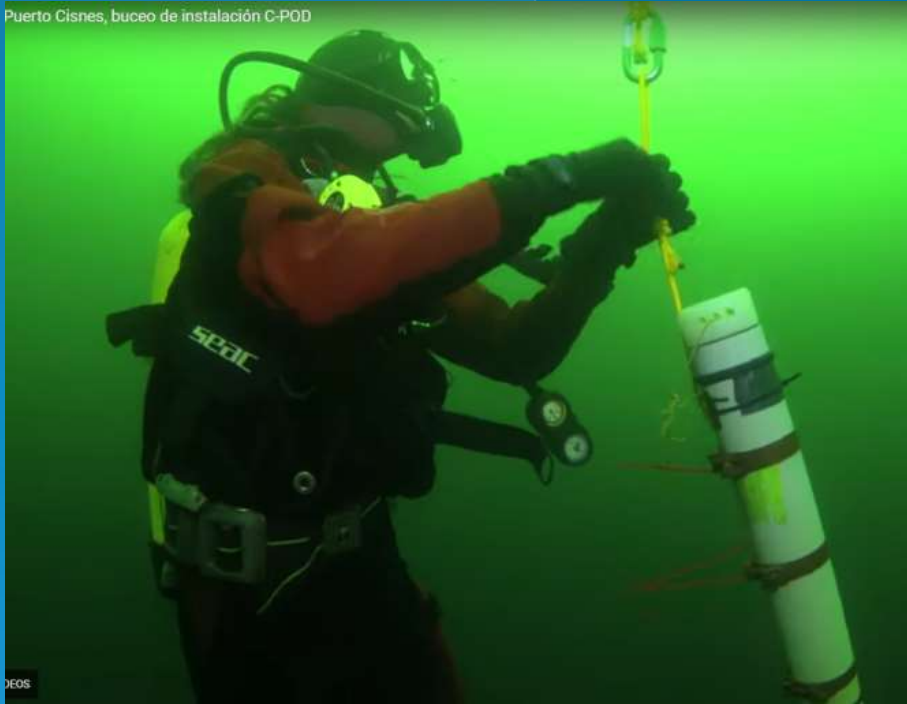
Puerto Cisnes, buceo de instalación C-POD